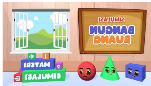
Gambar 1. Media Augmented Reality Pada Kelas Ekperimen

Maka dari itu seorang siswa diharapkan berhasil dalam meningkatkan minatnya apabila ia telah mengalami perubahan tingkah laku atau pribadi sesuai dengan yang diharapkan setelah proses pembelajaran. Pada hakekatnya meningkatnya minat belajar siswa dapat dilihat dari perasaan senang ketika belajar bangun ruang sisi datar, ketertarikan siswa pada materi bangun ruag sisi datar, keterlibatan siswa dalam berdiskusi maupun berkelompok, rajin dalam belajar dan mengerjakan tugas serta tekun dan disiplin merupakan hasil dari meningkatnya minat belajar siswa. Atau dengan kata lain peningkatan minat belajar siswa dapat dicapai oleh siswa dan akan Nampak secara keseluruhan dalam tingkahlakunya karna setiap proses pembelajaran terutama dalam peningkatan minat siswa akan menghasilkan perubahan-perubahan yang alami terjadi pada aspek aspek peningkatan minat belajar siswa. Siswa yang berhasil dalam meningkatkan minat belajarnya akan menunjukkan pola pola kepribadian yang harus sesuai dengan tujuan dalam penelitian ini. menggunakan media Augmented Reality dapat dilihat pada diagram garis dibawah ini.